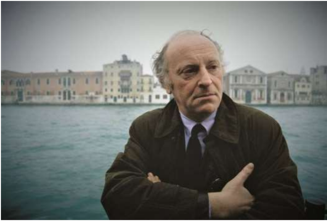
1945 — Евгений Киндинов, актёр театра и кино («Романс о влюбленных»).